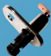
Датчики открытия дверей