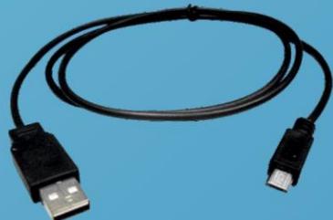
USB – mini USB кабель